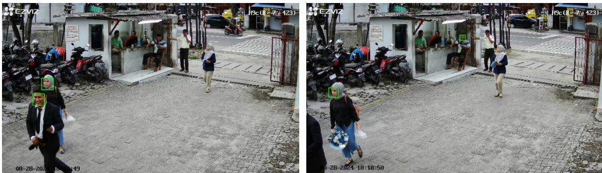
Gambar 3. Sample Pengujian Model